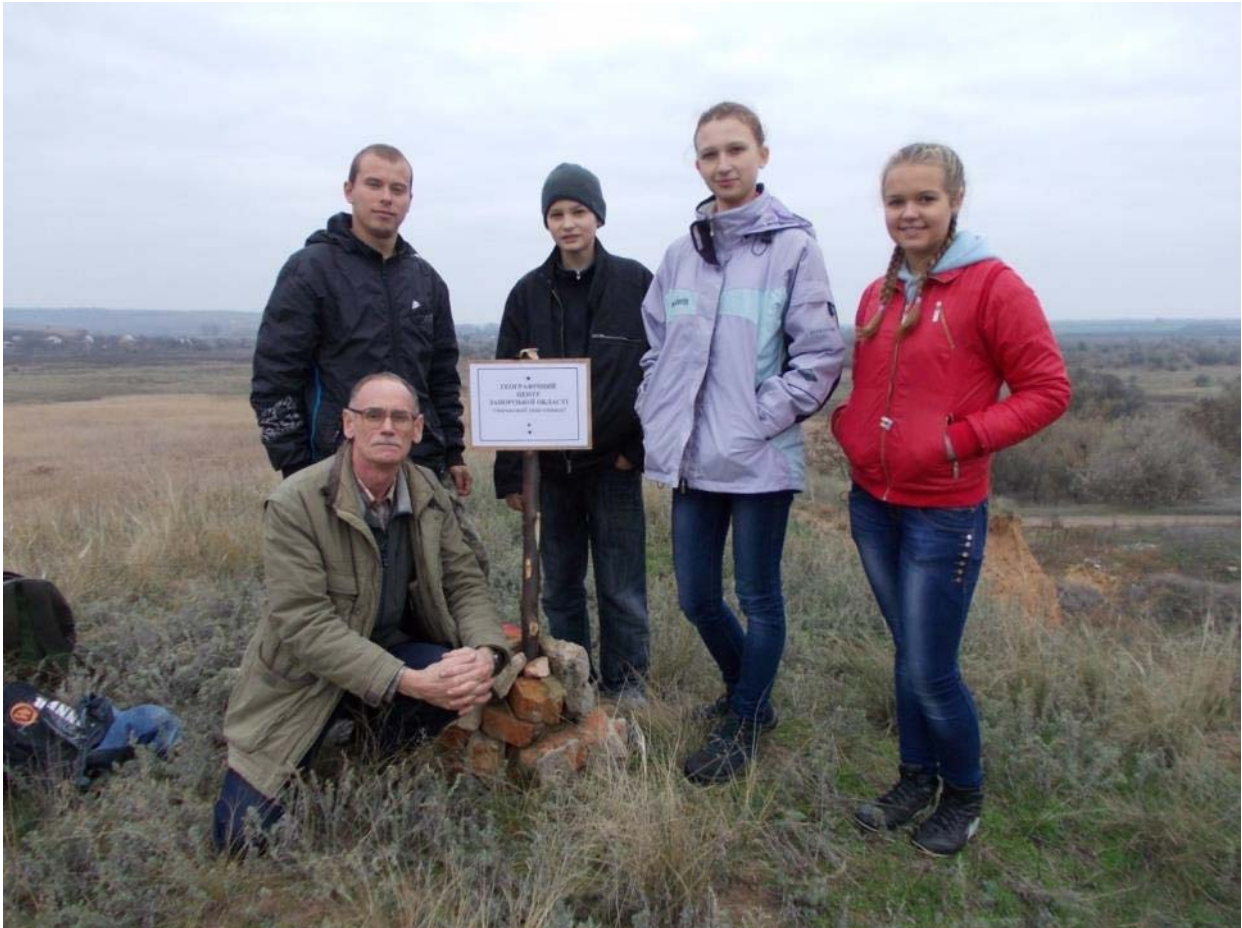
Встановлений Географічний центр Запорізької області

Пошукова ініціативна група дослідників нашого краю віднайшла та зафіксувала на місцевості та мапах символічний географічний центр області