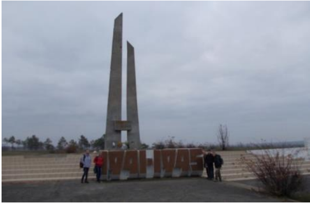
Пам'ятник загиблим у Другій світовій війні біля місця встановлення знака