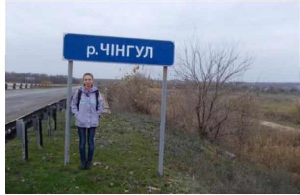
Орієнтири – дорожній знак «р. Чингул» та міст, що перетинає її долину