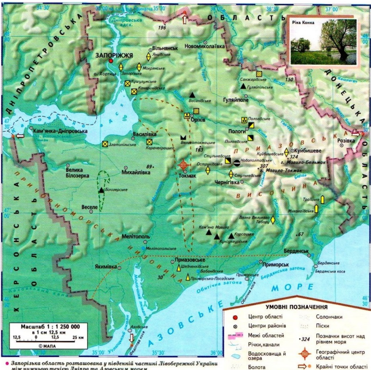
Розташування географічного центру Запорізької області на карті