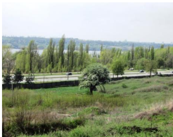
За легендою – «Тарасова груша» у м. Запоріжжя

Острів Хортиця за часів Шевченка належав 29 німецьким родинам колоністів, які одержали за Катерини II великі пільги і вели тут господарство. Прожили анабаптисти на острові 130 років, аж до початку 20 ст., отже Тарас Григорович саме їх і застав на козацькому острові. У нього склалися гіркі враження від побаченого. Ідеальний топос, яким він уявляв собі легендарний острів, місце козацької вольниці, був відданий чужинцям. Він очікував відчутти тут козацький дух, а побачив колонізований край. Може тому у 1844 році, через рік після гостин на Запоріжжя, в листі до Я. Кухаренка, свого товариша, Шевченко так сформулював свої враження: «Був я уторік на Україні. І на Хортиці, і скрізь був і все плакав...сплюндрували нашу Україну катової віри німота з москалями, щоб вони переказилися».