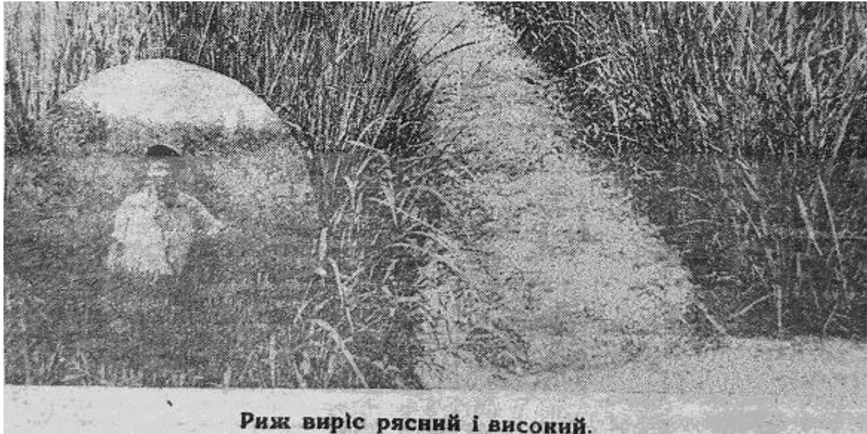
Риж виріс рясний і високий.

Строкатими стають сторінки від опису винаходів та апробації техніки на острові та їх фотозображень: «Борючись по-ударному за здійснення виробничих завдань ...в радгоспі на о. Хортиці тепер деталізують проект винаходу сівалки просапних культур. За грубо орієнтовними підрахунками, застосування цієї сівалки на площі 300 га можна заощадити 1500 крб...»