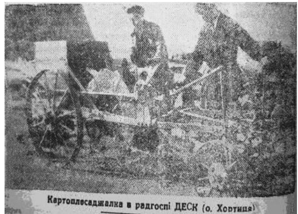
Картоплесаджалка в радгоспі ДЕСК (о. Хортиця)

Починаючи з 30 років, коли з великим масштабом розгорнулися будівельні роботи ДніпроГЕСу було організовано ДЕСК (трест Дніпровських електросількомбінатів). Він об'єднував всі електросількомбінати, регулював й планував всю їхню виробничу й організаційну діяльність. ЕСКИ в свою чергу об'єднували всі виробничі одиниці, що знаходяться на їхній території, зокрема, радгоспи, державні сільсько-господарчі переробні підприємства, колгоспи тощо. Дуже часто в статтях місцевих газет згадується радгосп на о. Хортиця, його діяльність, плани та соцзмагання. Деякі витримки з матеріалів широко та всесторонньо розкривають, те, що вирощувалося на острові, дослідницькі роботи і т.п.