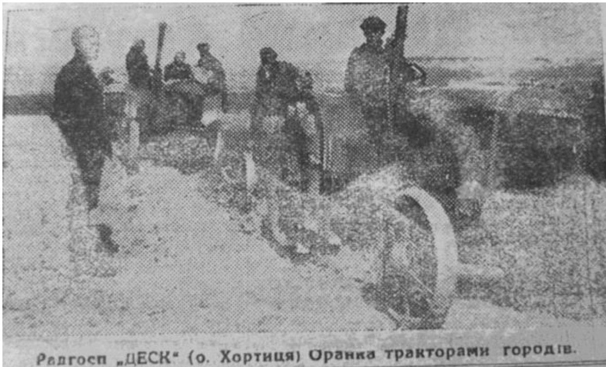
Радгосп „ДЕСК“ (о. Хортиця) Оранка тракторами городів.

З великого пласту опрацьованого друкованого матеріалу газети «Червоне Запоріжжя», «Степова коммуна», «Новь» періоду 1922-38-мі роки, дуже поширеною стала інформація про острів Хортицю як перлину, але не історичну, природничу, чи археологічну, а сільськогосподарську.