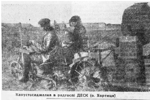
Капустосаджалка в радгоспі ДЕСК (о. Хортиця)