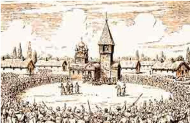
Рада на Січі (Січове коло)

Розглядаючи бойове мистецтво «Спас» як частину культурної спадщини предків, насамперед, слід зробити наголос на його обрядовості, яка залишилась у традиції «Спасу» до наших днів і має історичні корені, що сягають давніх часів існування запорозького козацтва.