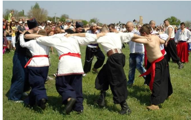
Козацьке коло перед змаганнями «Спас»

У сакральній культурі запорозького козацтва одним з основних елементів було поняття Кола. Козаки, під час проведення найважливіших рад, де вирішувалась доля умов їх подальшого життя, завжди ставали в коло. Ці ради мали назву Коло, Велике Коло, Січове коло, тощо. Саме коло, згідно досліджень академіка Ю. О. Шилова, є одним з найдавніших державотворчих символів в історії прадавніх цивілізацій на землі [3, С. 23.].