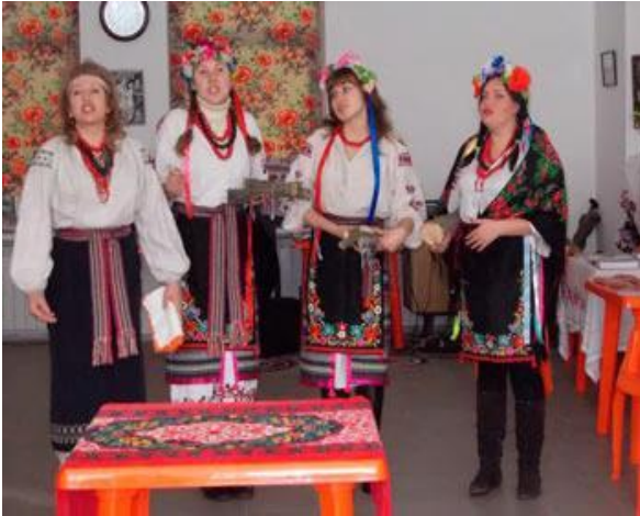
Фольклорно-обрядовий колектив «Оріани» (Запоріжжя) на святі Колодія

Етнографічне дослідження народного свята Колодія, відзначення свята у різних релігій та народів світу