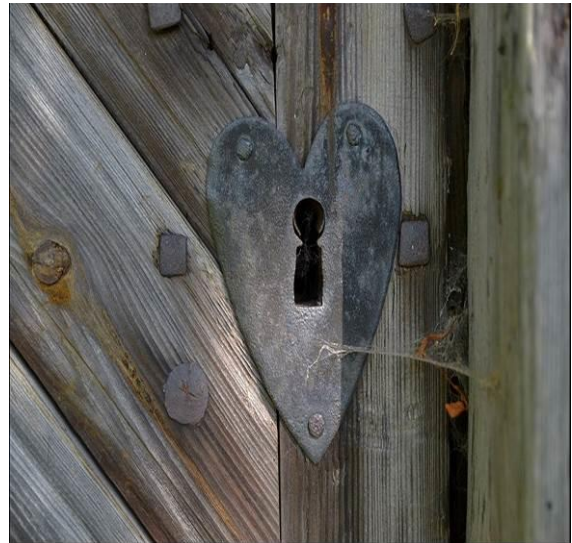
Замкова щілина у вигляді сердечка

На Триглаві (Тризубі) зображена боротьба Перуна і Велеса на середньому зубі: стріла (копіє) б'є у сердечко в нижній частині, або копіє б'є між рогів Велеса.