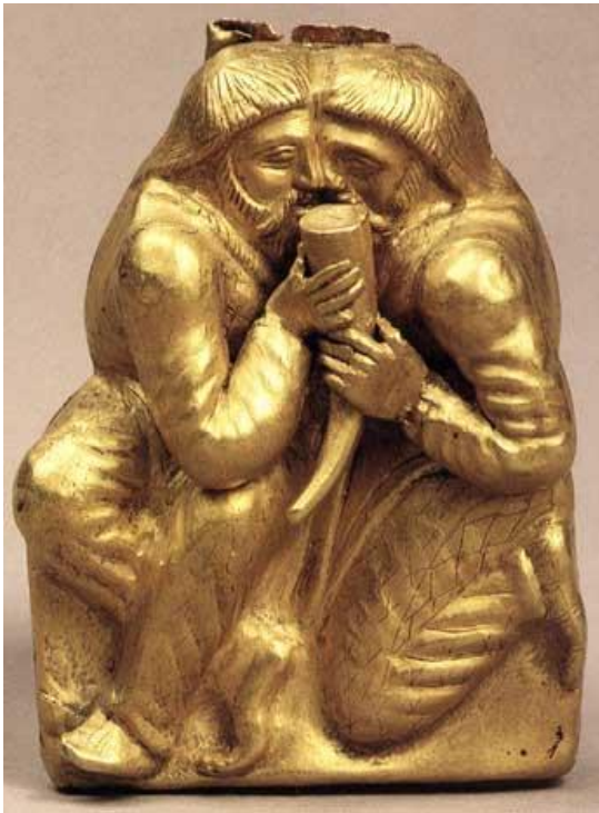
Скіфська церемонія «Побратимство» (золота пластина, IV ст. до н. е., кримський курган Куль-Оба)

– то були наречені, місія яких була в тому, щоби вести контроль за новими державними утвореннями: і особистою присутністю, і вихованням спадкоємців престолу в дусі поваги до релігії Центру та традицій Батьківщини.