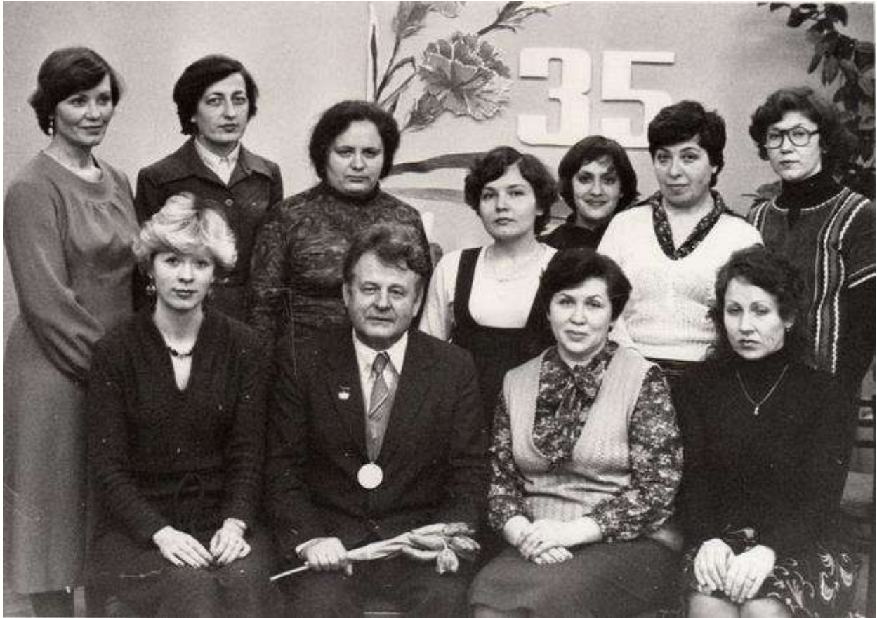
Працівники довідково-бібліографічного відділу, 1982 р.