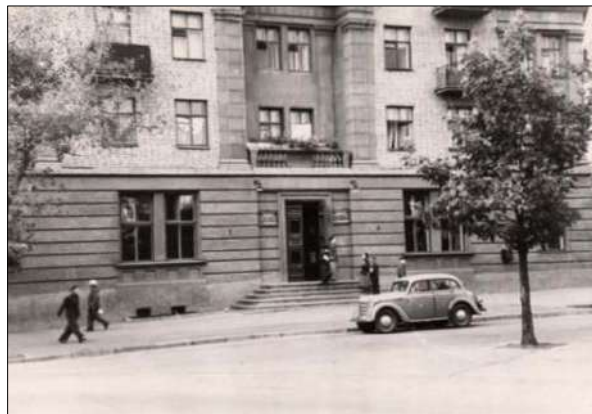
Приміщення Запорізької обласної бібліотеки на вул. Лобановського

І тільки у 50-ті роки минулого століття бібліотечне краєзнавство почало відроджуватися по-справжньому. Імпульсом його розвитку стало створення фундаментального 26-ти томного видання «Історія міст і сіл Української РСР», у тому числі і Запорізької області. Це викликало інтерес і привернуло велику увагу до вивчення місцевої історії, до пошукової, науково-дослідницької краєзнавчої діяльності значною кількістю професіоналів і любителів.