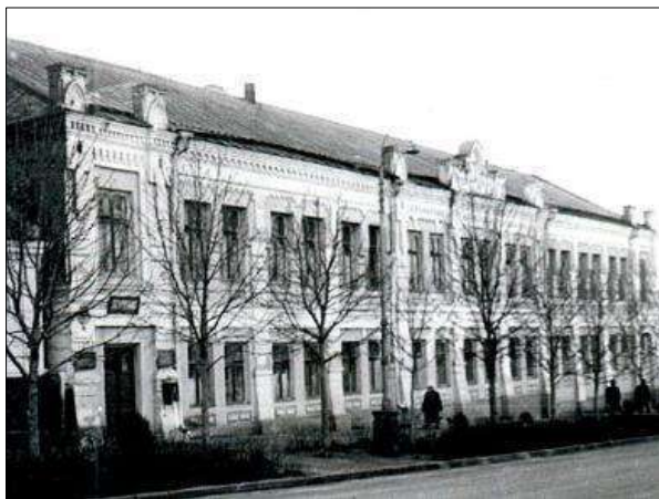
Одне з перших приміщень бібліотеки

Бібліотечне краєзнавство в нашому краї має давні традиції. Бібліотеки навчальних закладів, науково-просвітницьких товариств та приватних осіб завжди, поруч із навчальною, науковою, художньою, церковною літературою, збирали та зберігали хроніки місцевих подій, статистичні матеріали.