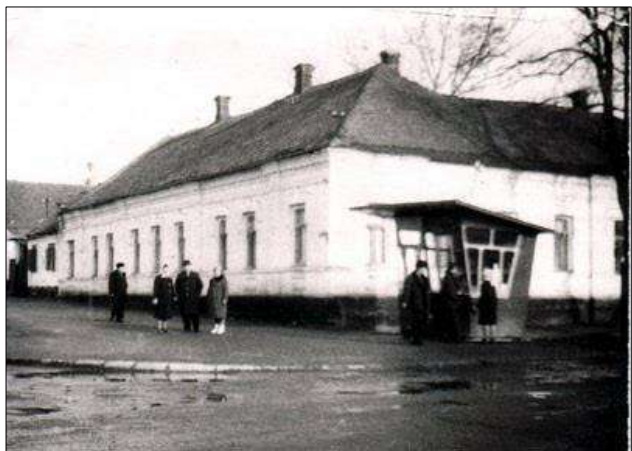
Бібліотека на вул. Лепіка

Продовжила цю традицію і наша бібліотека, створена у 1904 р. Краєзнавча робота проводилась в ній від часу її заснування, тоді ще на рівні збирання місцевих матеріалів.